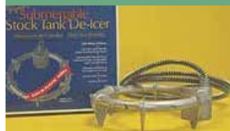
Submersible pour réservoirs TANH15 129,75 $