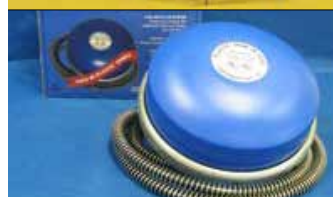
Flottant pour réservoirs TANH12 78,90 $

Les prix sont sujets à changements sans préavis.